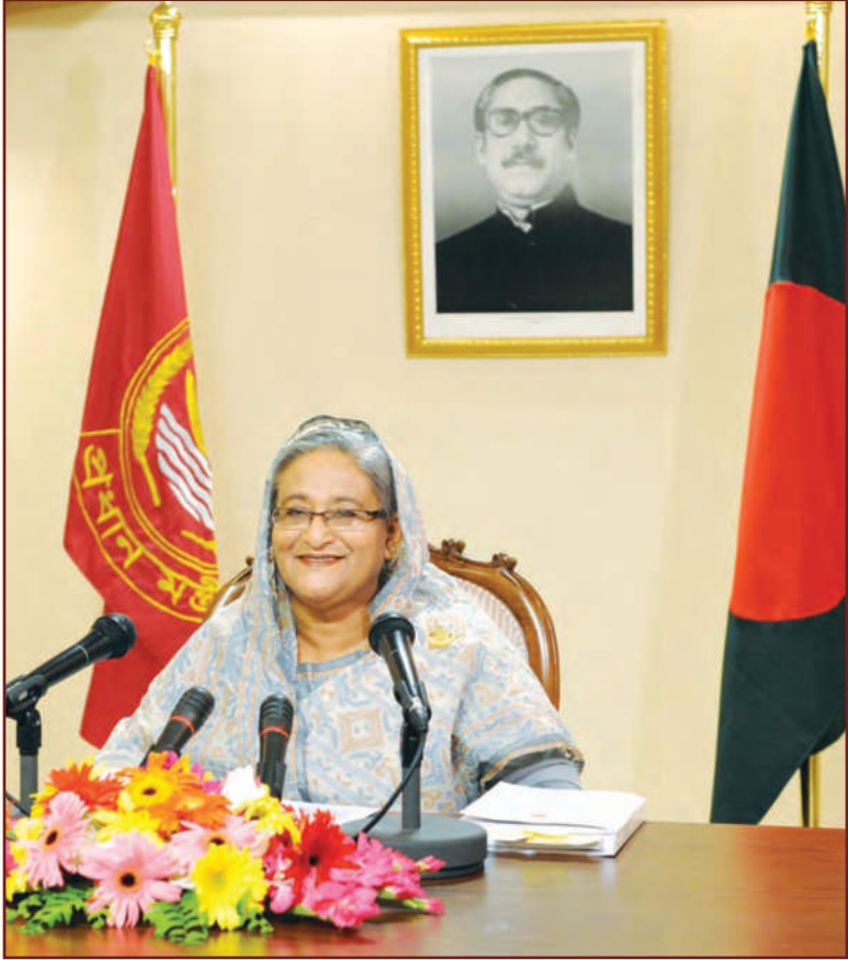
গণপ্রজাতন্ত্রী বাংলাদেশ সরকারের মাননীয় প্রধানমন্ত্রী শেখ হাসিনা