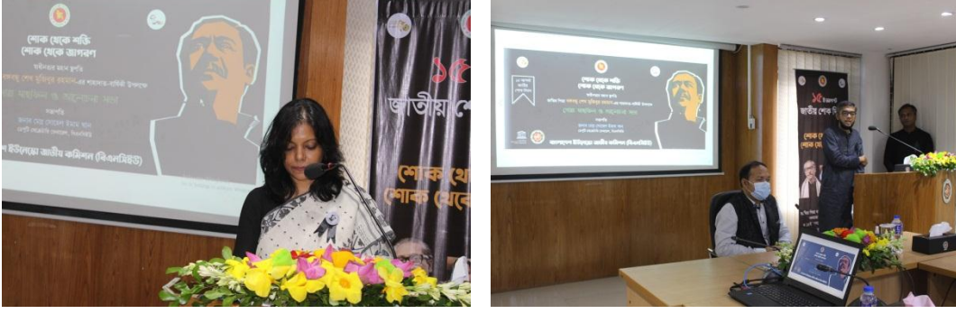
বিএনসিইউ কর্মকর্তাবৃন্দের উপস্থাপনা

দেখা নয়াদীন' থেকে চুম্বক অংশ পাঠ করা হয়। বঙ্গবন্ধুর খুনিদের বিচারের আওতায় নিয়ে আসায় মাননীয় প্রধানমন্ত্রীর প্রতি ধন্যবাদ ও কৃতজ্ঞতা প্রকাশ করা হয়।