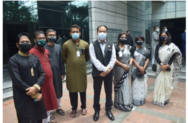
আন্তর্জাতিক মাতৃভাষা ইন্সটিটিউটে পুষ্পার্ঘ অর্পণ